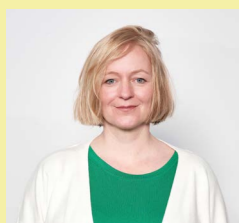
Martina Knittel Grünhof GmbH