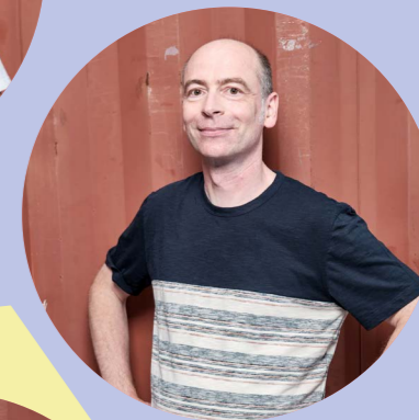
Wolfgang Fischer Buchhaltung