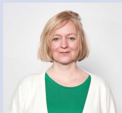
Martina Knittel Grünhof GmbH